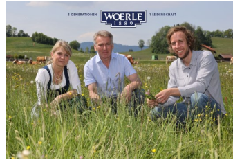
Biodiversität in den Händen der Landwirte, Gebrüder Woerle.

Anmeldung: +43 (0)664 5205203 oder office@tauriska.at