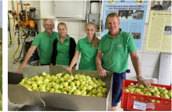
Obstpresse Bramberger.

Dialog zum Green Infrastructure goes business award , welcher erstmals 2022 in Bozen vergeben wurde. Darunter waren zwei Preisträger aus Salzburg, welche in diesem akademischen Wirtshaus über ihre Projekte sprechen werden: